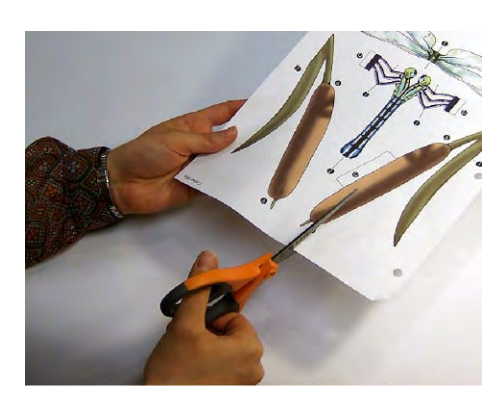
1.Cut out all pieces.

You will need: scissors, glue for paper (glue sticks work well)