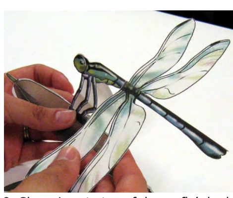
8. Glue wings to top of dragonfly's body.